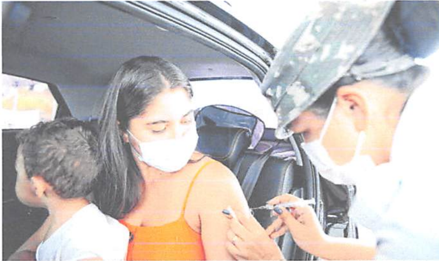
De acordo com a Secretaria Municipal de Saúde (Semus), cerca de 100 mil pessoas são esperadas para receber a segunda dose de forma antecipada

FDLHAS: 139 PROC: 454/2021 Ass: R. R. R.